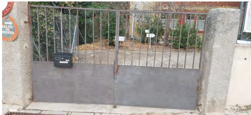
Vecino de Cocentaina